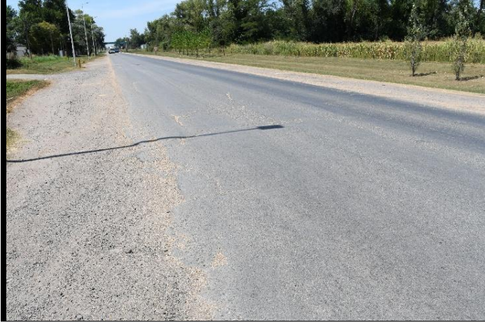
Fotos Perfil km 337,26